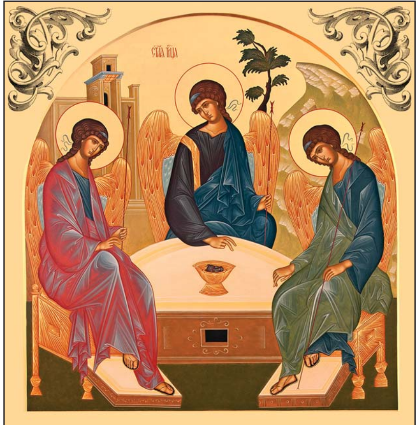
Икона письма Андрея Рублева

В отличие от более ранних иконописцев, Рублев не стал изображать встречу Авраамом уставших путников возле своего дома, как это описывается в Библии. Его икона — «богословие в красках», раскрывающее смысл православного учения о Троице. Мы видим лишь трех ангелов за трапезой; на столе — единственная чаша, символизирующая святое Причастие. Основой композиции является круг, в который как бы вписаны фигуры ангелов. Это придает изображению характер благодатного покоя, в котором пребывает Бог. Позы и лики ангелов отражают совершенную любовь, связывающую лица Святой Троицы.